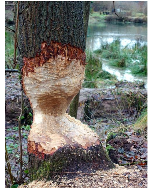
Auch vor einer Eiche macht der Biber keinen Halt