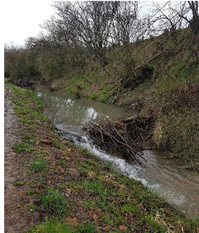
Kaskadenartiger Stau eines kleinen Fließgewässers durch mehrere Biber-Dämme

Aufgabenerweiterung bei den Funktionsbeschäftigte für den Naturschutz (FN) auch außerhalb der Schutzgebietskulisse ab 2021 0,5 bis 2 Stellen / Forstamt