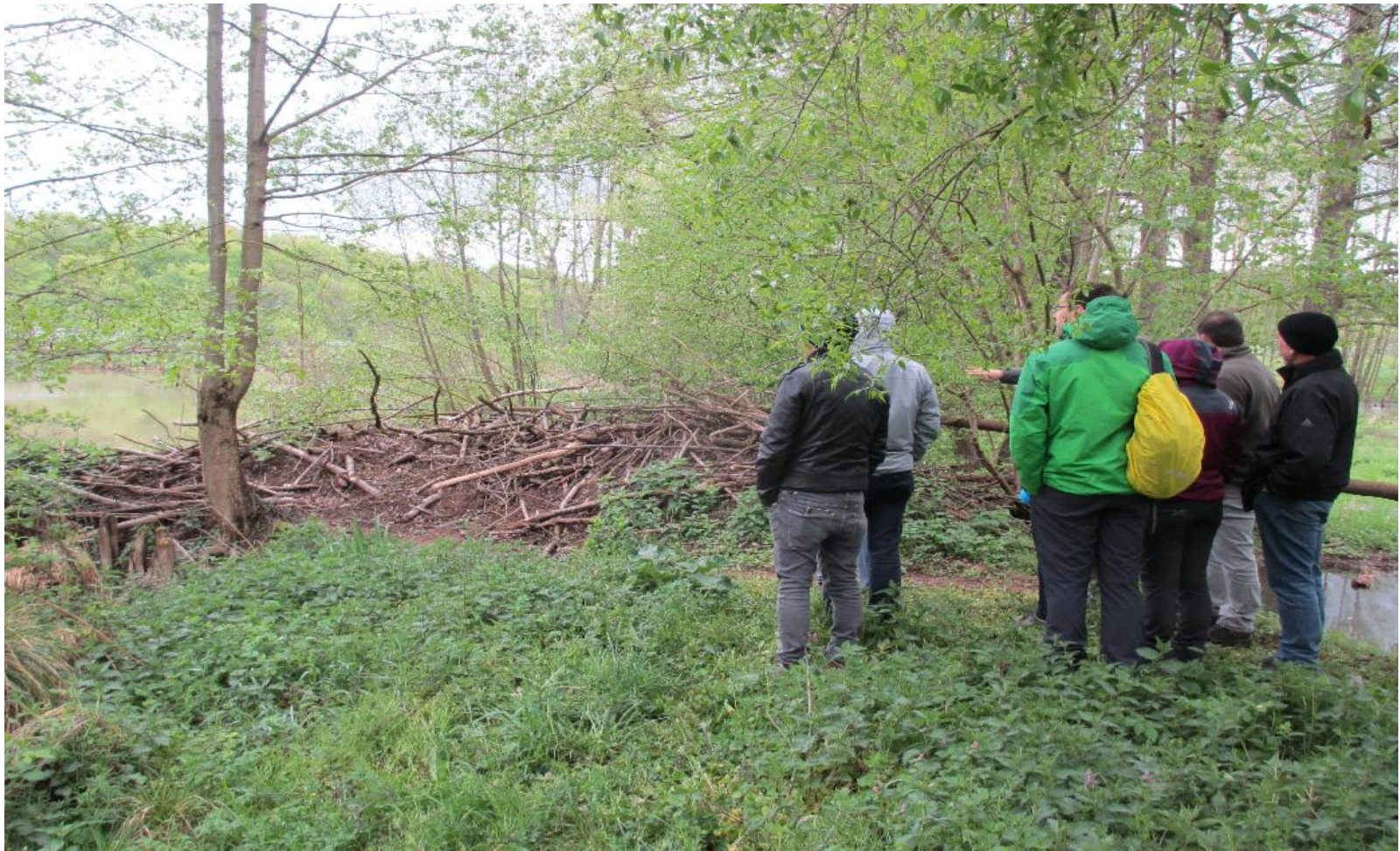
Exkursion der HMUKLV-Fachabteilung in das NABU-Biber-Schulungsgelände „Biberteiche bei Bellings“ (Foto: R. Geschwindner).