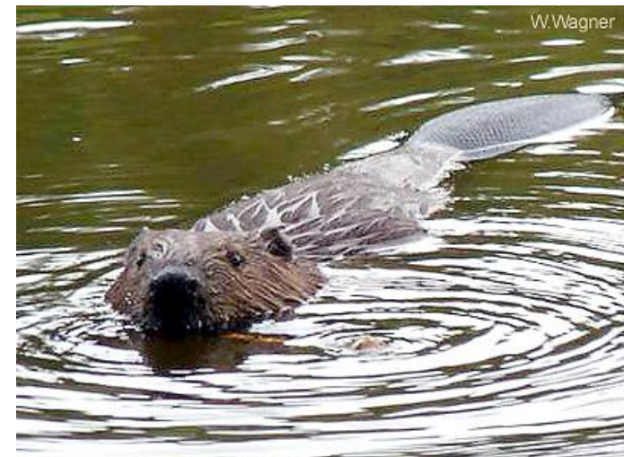
Biber im hessischen Biberrevier HU 86