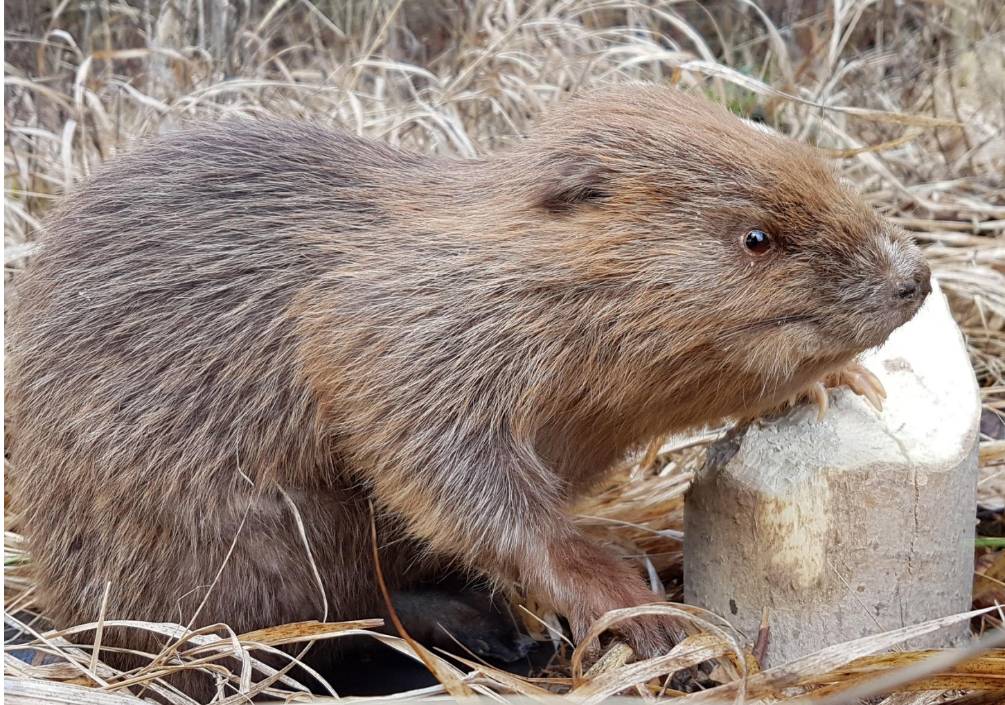
Schulungspräparat „Jungbiber“